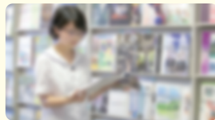
学期ごとの宿題考査、高校3年生での模擬試験(本校/7回)、進路説明会(高校1・2・3年:毎年)、各大学による入試説明会(高校1・2・3年:毎年)などの実施や過年度の進路結果をまとめた「進路のてびき」を発行しています。先輩から後輩への「励まし」「アドバイス」が充実しています。