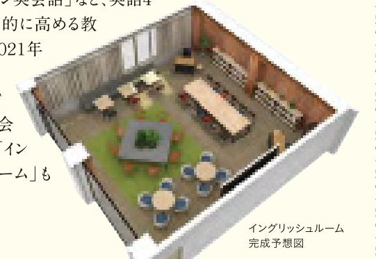
イングリッシュルーム 完成予想図

定評のある英語教育も、進化を遂げています。フィリピンのネイティブ講師にマンツーマンで英会話レッスンを受ける「オンライン英会話」など、英語4技能を総合的に高める教育を強化。2021年夏には、放課後、ALTと気軽に英会話を楽しむ「イングリッシュルーム」も設置します。